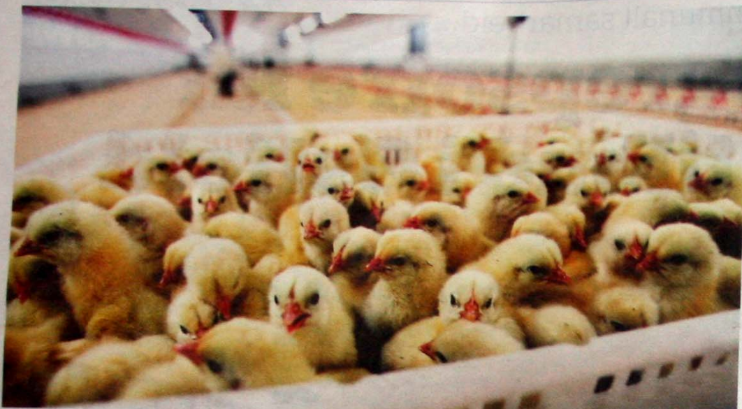
TRANGT Når 60.000 kyllinger skal i hus samtidig blir det fort litt kamp om å komme først ut av esken.