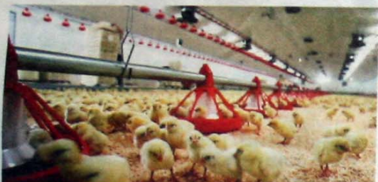
RETT I MATFATET Reisen fra Våler i Solør til Våler i Østfold tar på en liten kyllingkropp og appetitten er på topp.

Håpet er å komme frem til noe annet lokalene kan brukes til når de ikke er fylt av pip og skral fra tusenvis av kyllinger.