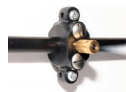
Eksempel viser vægmonteret dysse